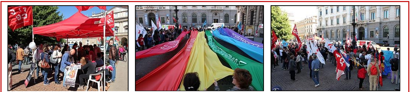
Sciopero 20 maggio: immagini della manifestazione a Milano, Piazza della Scala