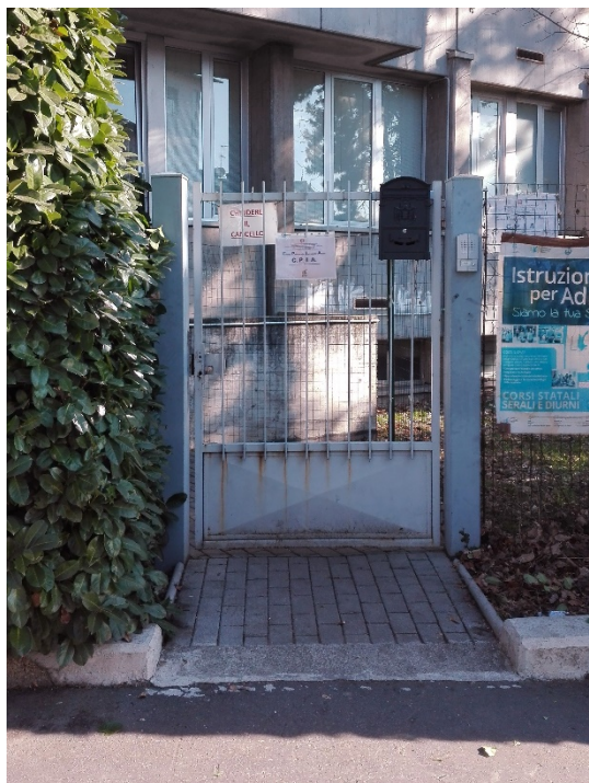
(Ingresso CPIA sede di Legnano)

In ottemperanza all'art. 5 co. 8 Decreto 28/08/2018, n. 129 "Regolamento concernente le Istituzioni generali sulla gestione amministrativo-contabile delle istituzioni scolastiche", si sottopone al Consiglio di Istituto, per l'esame, il Programma Annuale per l'esercizio 2019, unitamente all'esposizione dei criteri di ordine didattico, economico, amministrativo seguito nella sua elaborazione.